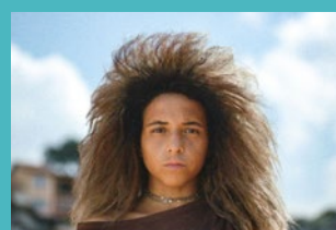
JE M'APPELLE BAGDAD De Caru Alves de Souza