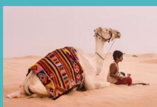
L'ENFANT CHAMEAU De Chabname Zariâb