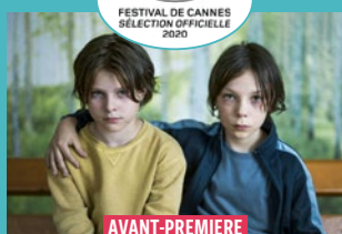
UN MONDE De Laura Wandel