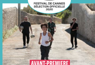
MES FRÈRES ET MOI De Yohan Manca