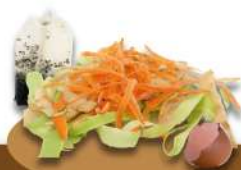
Déchets de cuisine

(Épluchures fruits et légumes, marc de café et de thé, restes de repas...)