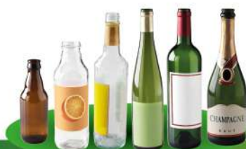
Bouteilles et flacons en verre