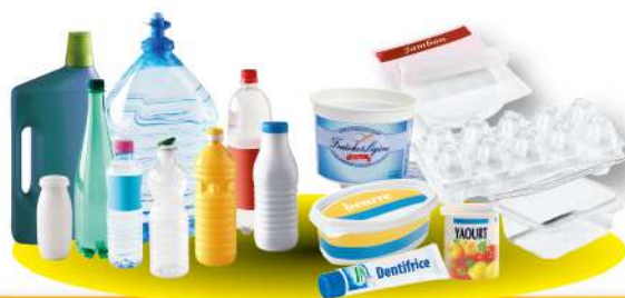
Bouteilles, flacons, pots et barquettes plastiques