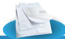
Enveloppes, courriers et lettres