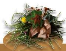
Déchets de jardin

(Feuilles mortes, tontes pelouses, branchages, paille...)