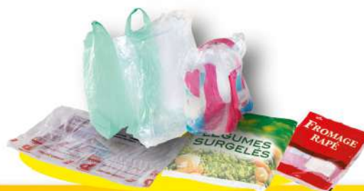
Sacs et films plastiques