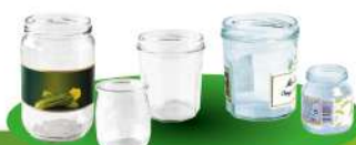
Pots et bocaux en verre